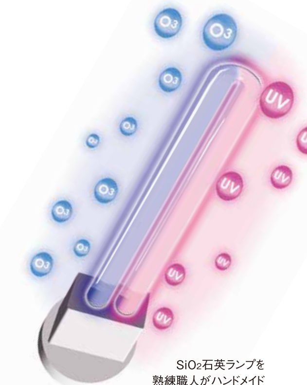
SiO 2 石英ランプを 熟練職人がハンドメイド